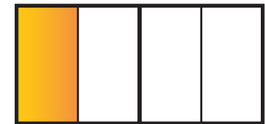
Lokal A Lokal B Lokal C Lokal D